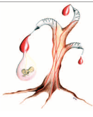
Illustrazione di Sabrina Dazi, Liceo Artistico classe IV B.

Una nuova realtà nel mondo web si va delineando con forza e con ritmo di crescita travolgente sia per il numero di nuovi utenti coinvolti (in costante raddoppio ogni 7 mesi) che di pagine pubblicate: i blog. Sono già 60 milioni nel mondo e aumentano al ritmo di centomila al giorno: uno al secondo!