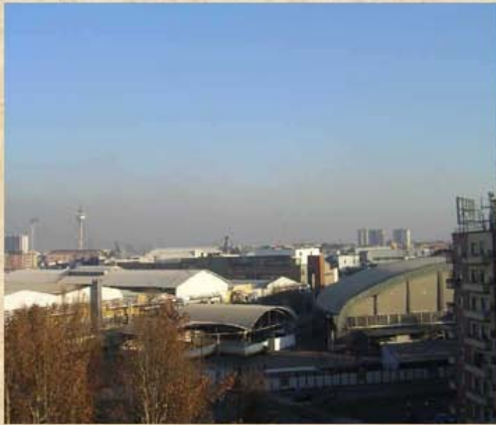
Piazza Arduino angolo Berengario