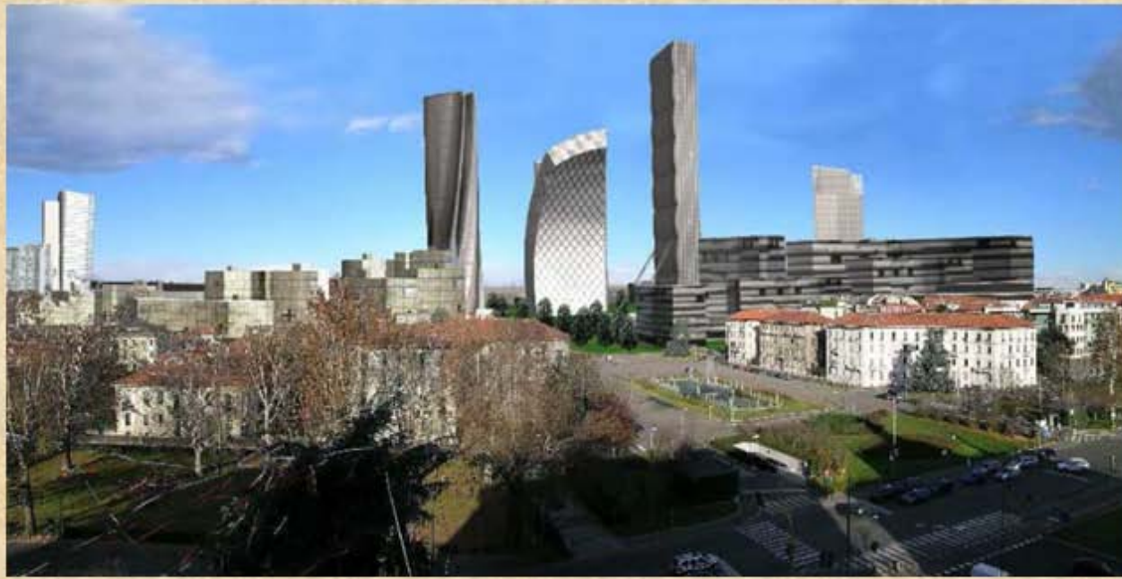
Piazzale Giulio Cesare